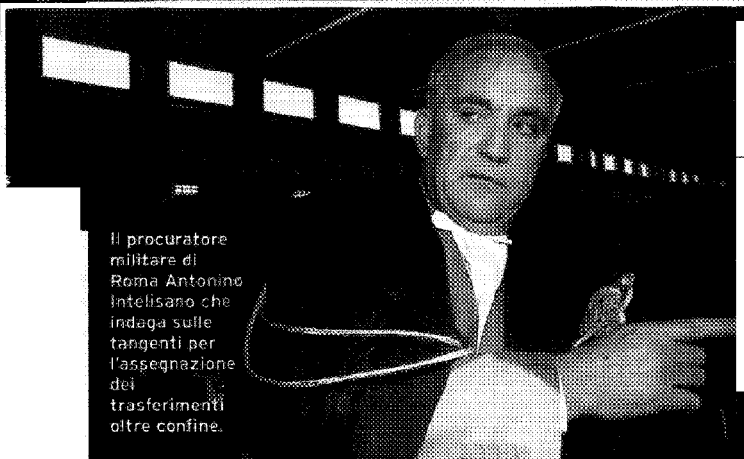
Il procuratore militare di Roma Antonino Intelisano che indaga sulle tangenti per l'assegnazione dei trasferimenti oltre confine.