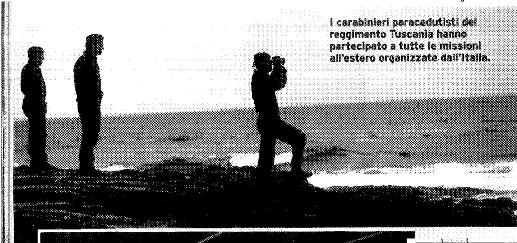
I carabinieri paracadutisti del reggimento Toscana hanno partecipato a tutte le missioni all'estero organizzate dall'Italia.