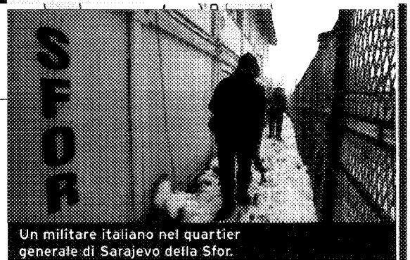
Un militare italiano nel quartier generale di Sarajevo della Sfor.