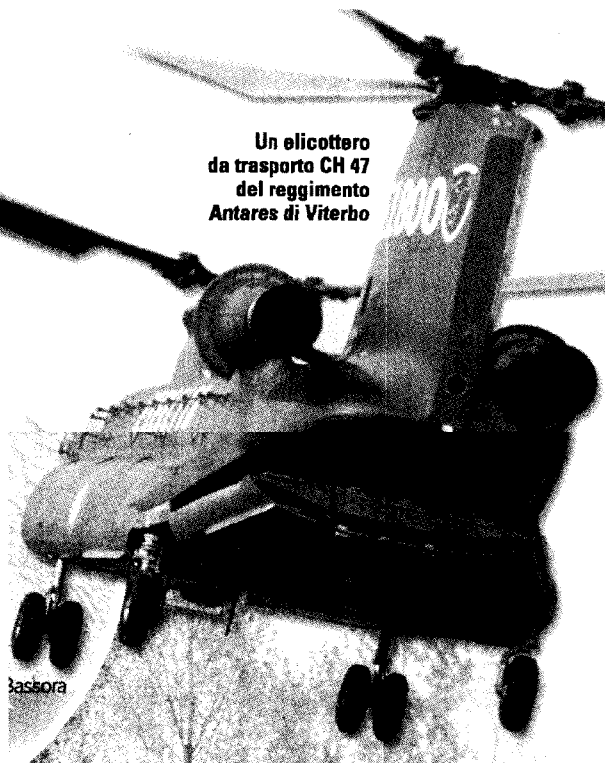
Un elicottero da trasporto CH 47 del reggimento Antares di Viterbo

Fonte: ministero della Difesa, dati aggiornati al 4 marzo 2004