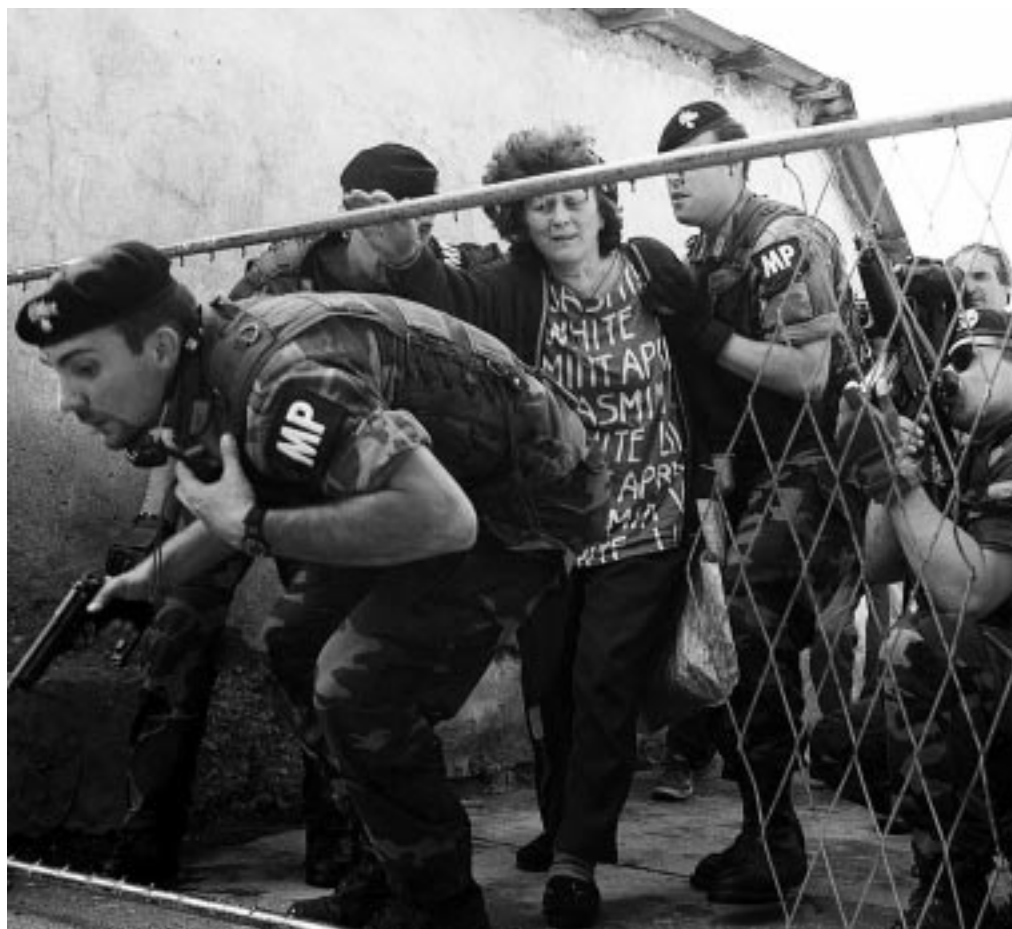
Carabinieri del «Toscana» impegnati in operazioni di polizia militare durante la missione in Kosovo

A Palazzo di Giustizia, però, c'è ancora molta cautela. Lo stesso Guariniello fa notare che il nesso causale fra il linfoma di Hodgkin e l'esposizione all'uranio impoverito non è ancora stato scientificamente dimostrato, inoltre i proiettili radioattivi americani non sono l'unica pista che stanno battendo gli investigatori. Dall'indagine risulta infatti che ci sarebbero casi di malattia anche fra soldati che non sono mai stati nei Balcani, ma che durante il loro servizio sono venuti a contatto con altre sostanze cancerogene. Ad esempio il benzene, largamente usato nelle caserme italiane per pulire e tenere in ordine le armi.